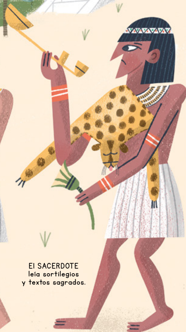
EL SACERDOTE leía sortilegios y textos sagrados.