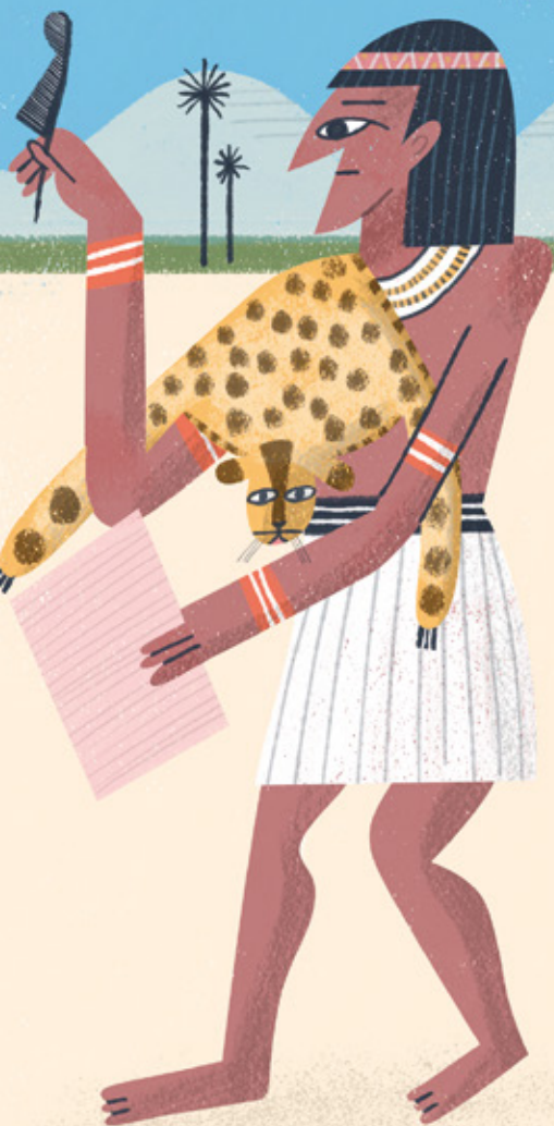
EL MARCADOR trazaba una línea por el lado izquierdo del abdomen.