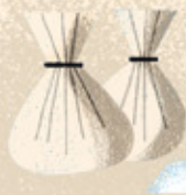
NATRÓN Una sal natural que absorbe la humedad y descompone la grasa