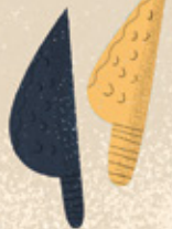
CUCHILLO ESPECIAL DE SÍLEX Para abrir el cadáver