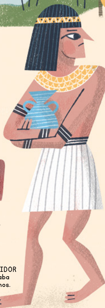
EL ENCURTIDOR conservaba los órganos.