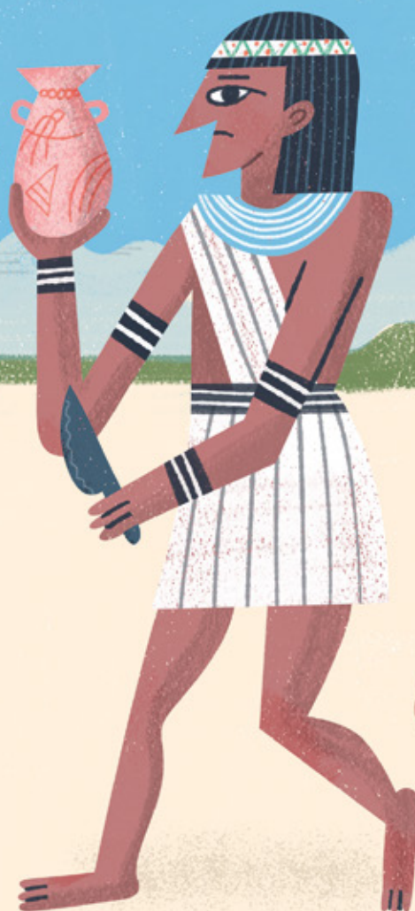
EL CORTADOR hacía una incisión en la línea y extraía los órganos internos. Nada más hacerlo, salía corriendo del taller, y otros lo perseguían tirándole piedras.