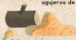
RESINA Para cubrir el cadáver después de rellenarlo